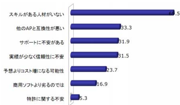
図 1 オープンソースソフトウェアに対する問題点や不安 (矢野経済研究所の調査結果を基に作成 [3] )

ユーザ企業がオープンソースソフトウェアに対する主な懸念事項は矢野経済研究所の調査 [3] によると、人材不足・互換性・サポート・実績となっている。